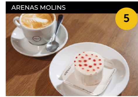
Maillot de punts Mousse de nata i vainilla amb maduixes. + cafè o cafè amb llet

Avinguda de Barcelona, 4 En horari d'obertura de l'establiment