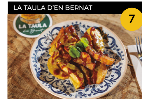
Braves Café de París Patates braves casolanes amb salsa Cafè de París i salsa brava + aigua o refresc o canya

Plaça del Mercat, 10 En horari d'obertura de l'establiment