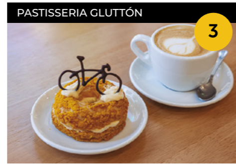
La Roue Jaune Mini Paris-Brest amb una crema mussolina d'ametlla + cafè o infusió o refresc

Carrer de Jacint Verdaguer, 72 En horari d'obertura de l'establiment