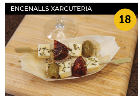
L'E-tapa Reina Dues broquetes de xoriç ibèric, formatge tendre i olives verdes + copa de Lambrusco rosat

Carrer de Rafael Casanova, 30 (Mercat Municipal) En horari de els divendres, de 12 h a 14 h i de 17 h a 19 h; els dissabtes, de 12 h a 14 h