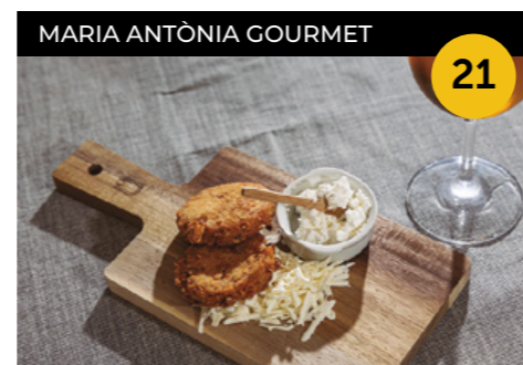
L'Escapada de Llardons Miniarepes de llardons sobre un llit de formatge blanc ratllat veneçolà, coronades amb un sospir de nata criolla salada + cervesa Victòria Màlaga

Carrer del Doctor Barraquer, 26 En horari d'obertura de l'establiment