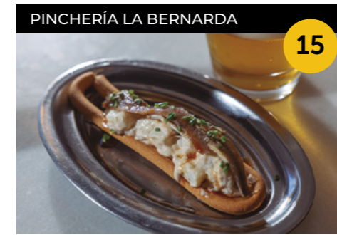
Marinera (Nom original: Bicicleta) Patata sevillana sobre un minibastonet de pa amb anxova, seitó i salsa aperitiu + quinto o copa de vi blanc o negre

Carrer de Ponent, 9 En horari d'obertura de l'establiment