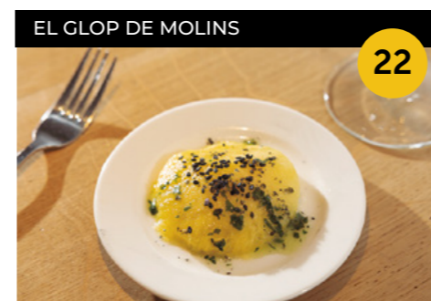
Le Maillot Jeune Ravioli gegant de còctel de gambes + vermut o copa de vi o cervesa o refresc

Carrer del Molí, 3 En horari d'obertura de l'establiment