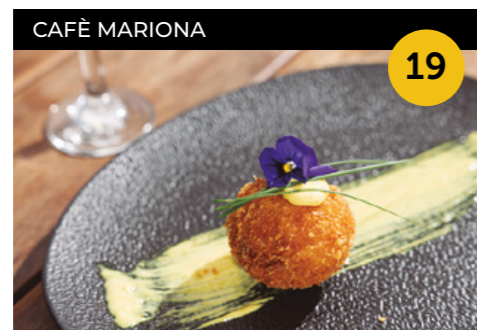
Maillot Jaune Rouge Croquetó de gambes vermelles + canya o copa de cava o de vi

Carrer de Menéndez Pelayo, 30 En horari d'obertura de l'establiment