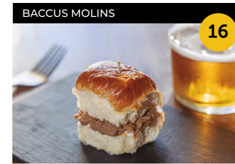
Briox sobre Rodes Pa briox de pulled pork acompanyat amb salsa Pedro Ximénez, panses i maionesa + copa de cervesa o copa vi

Carrer del Foment, 6 En horari d'obertura de l'establiment