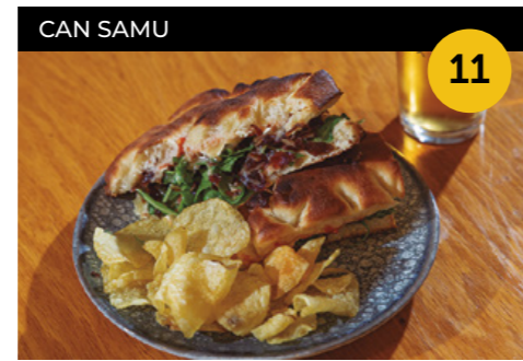
Focaccia Maillot Jaune de CAN SAMU Pa de foccacia amb tomàquet sucat i encenalls de formatge Brie gratinat + zurito de cervesa

Plaça de Catalunya, 24 En horari d'obertura de l'establiment