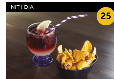
Tapa Trek Patates braves casolanes +Tinto de verano casolà

Passeig del Terraplè, 52 En horari d'obertura de l'establiment