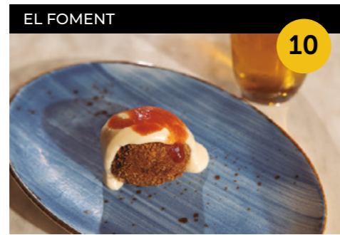
Bombatour Bomba de carn rostida + aigua o canya de cervesa o copa de vi

Passeig del Terraplè, 45 En horari d'obertura de l'establiment