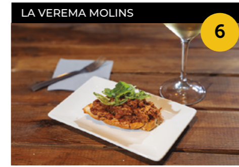
Indurain Pinxo de pulled pork amb ruca i les salses més Veremes! Intens i saborós + copa de vi blanc Baluarte

Carrer del Molí, 2, local 2 En horari d'obertura de l'establiment