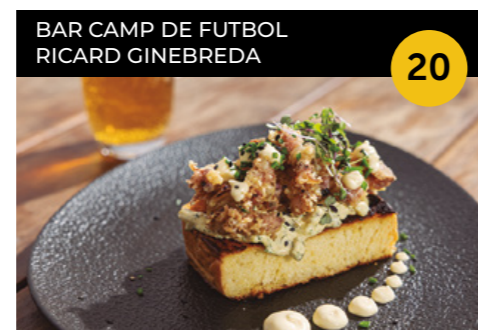
Le Côte des Chipirons Briox de calmarsons amb salsa tàrtara + canya o copa de cava o de vi

Carrer de Felip Canàlies (Bar del Camp de Futbol) En horari d'obertura de l'establiment