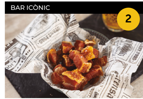
Tourrezno Torreznos + copa de cervesa o aigua

Carrer Major, 26 En horari d'obertura de l'establiment