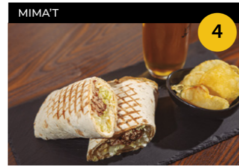
El Antipájaras Wrap de pa polar, vegetal de tonyina amb bacó, formatge i truita a la francesa + salsa de bacó fumada i patates xips + canya de cervesa

Carrer Major, 93, local En horari d'obertura de l'establiment