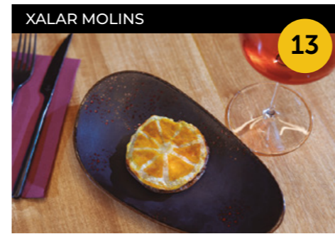
La Roda del Tour Pasta de panadons farcida de carn picada amb confit de ceba, formatge Emmental i cúrcuma + copa de vi negre o blanc

Carrer de Pere Calders, 14, local 1 En horari d'obertura de l'establiment