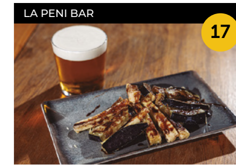
Etapa Reina Albergínies amb melassa de canya + canya de cervesa o clara

Plaça de Mercè Rodoreda, 6 En horari d'obertura de l'establiment