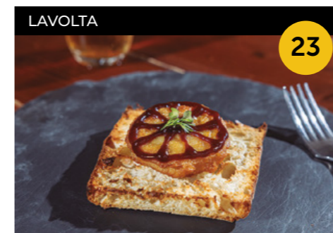
La Volta sempre roda Patata d'Olot farcida de carn rostida amb salsa Hoisin sobre base de pa de coca + canya de cervesa

Plaça del Palau, 3 En horari d'obertura de l'establiment