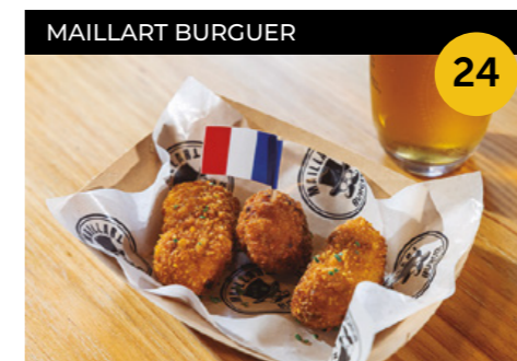
Croque Tour Trio de croquetes: pollastre al curri, mitjana de carn i costella a la barbacoa + canya o refresc o aigua petita

Carrer de Jacint Verdaguer, 58 En horari d'obertura de l'establiment