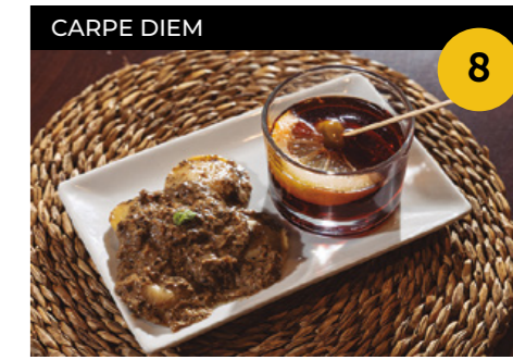
La Tapa Reina de Foie Lunette de foie amb crema de bolets + copeta de vi negre

Carrer de Ponent, 17 En horari d'obertura de l'establiment