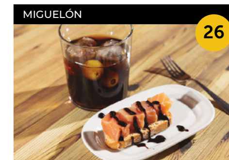
Miguelón Indurain Filet de salmó marinat sobre torrada i tomàquet semideshidratat. + Cervesa o vi.

Carrer del Molí, 11 A En horari d'obertura de l'establiment