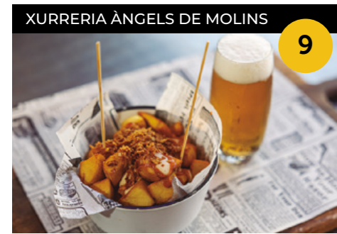
Pelotón Crujiente Tapa de patates braves amb ceba cruixent + canya de cervesa

Plaça de Catalunya, 27 En horari d'obertura de l'establiment