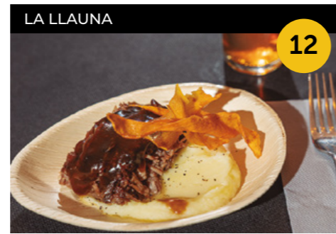
Tourmalet Lingot de vedella, cuinada a baixa temperatura, amb parmentier de patata i xips de boniato + canya de cervesa o refresc o copa de vi

Passeig del Terraplè, 55 En horari d'obertura de l'establiment