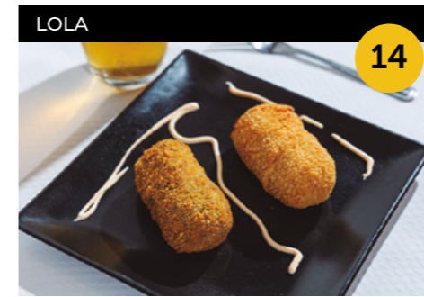
La Indurain Croquetó de sípia amb la tinta + croquetó de cua de bou estofada + copa de cervesa o refresc

Carrer del Molí, 2, local 1 En horari d'obertura de l'establiment